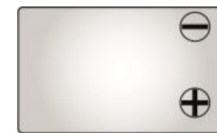
Тип клемм F2